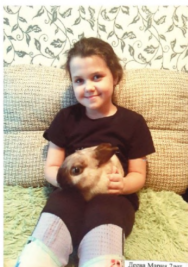
Дева Мария 7лет